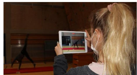
Abb. 2: Videografie einer Turnübung während des entsprechenden Seminars.

Das Konzept wurde in der 8. Ausgabe des heiEDUCATION Journals publiziert, zudem wurden Projekteinblicke im April 2022 bei einem Seminar in Palencia (Spanien) gegeben, was im Rahmen der Dozentenmobilität über Erasmus+ gefördert wurde. Die Veröffentlichung von Evaluationsergebnissen erfolgte in einem Sammelband des Forums des Netzwerks „Qualitative Forschung in der Sportwissenschaft“ .