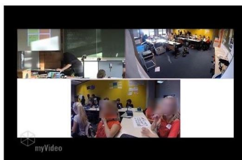
Abb. 2: Ausschnitt aus dem Moodle Kurs des videobasierten Moduls "TBLT in the Competence-Oriented EFL Classroom"