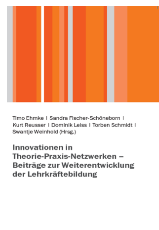
Abb. 1: ZYL-Sammelband

Im Rahmen der Veröffentlichung des ZYL-Sammelbandes sind auch jeweils ein Poster der acht Entwicklungsteams entstanden sowie eine „Landkarte“ zur Vernetzung des ZYL-Netzwerks