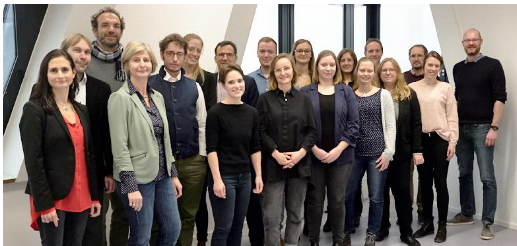
Abb. 3: Team des ZZL-Netzwerks – 2. Förderphase