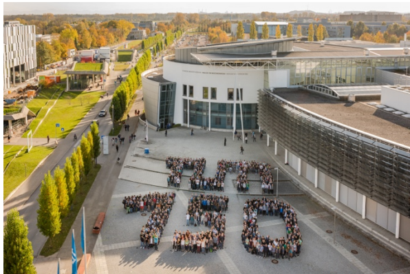
Andreas Heddergott / TUM

Weitere Information zu organisatorischen Abläufen, den Workshops und dem Programm finden Sie auf unserer Website: http://go.tum.de/939031